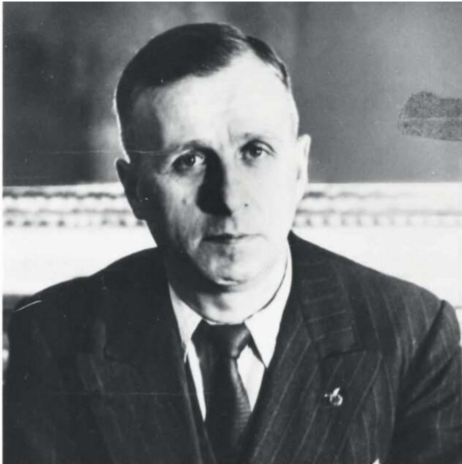
Ambroise CROIZAT le ministre de la sécurité sociale